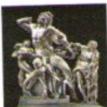
Progetto Laocoonte S.c.p.a